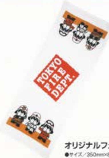
オリジナルフェイスタオル ●サイズ/350mm×830mm ¥850 (税込)