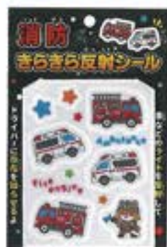
消防きらきら反射シール ●シールサイズ/115mm×90mm ¥80 (税込)