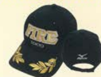
TOKYO FIREキャップ(子供用)(紺)