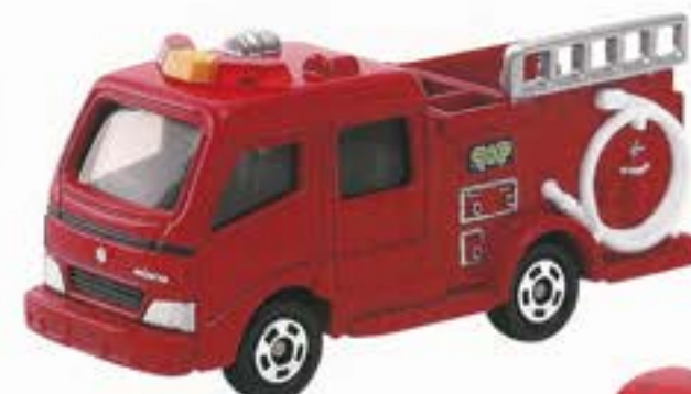
1 モリタCD-I型ポンプ車 (箱番41)