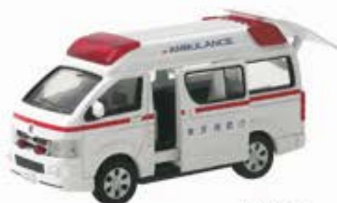
1 救急車 ●サイズ/120mm×210mm ¥1,800 (税込)