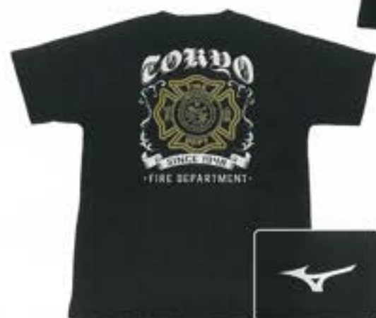
FIRE FIGHTER Tシャツ(黒)