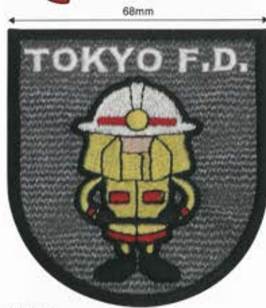
No1. 防火服1 ¥700(税込)