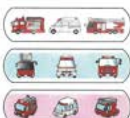
ばんそうこう(3枚入) ¥50 (税込)