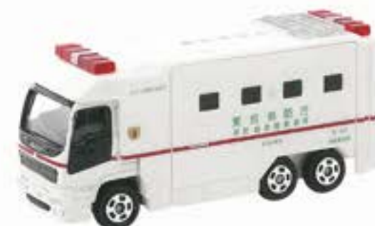
3 スーパーアンビュランス (箱番116)