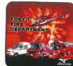
オリジナルハンドタオル ●サイズ/205mm×205mm ¥450 (税込)