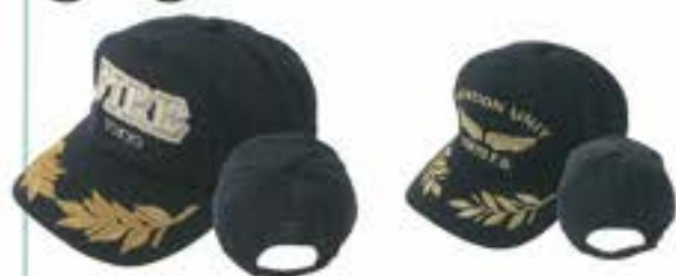
TOKYO FIREキャップ (大人用)(紺)