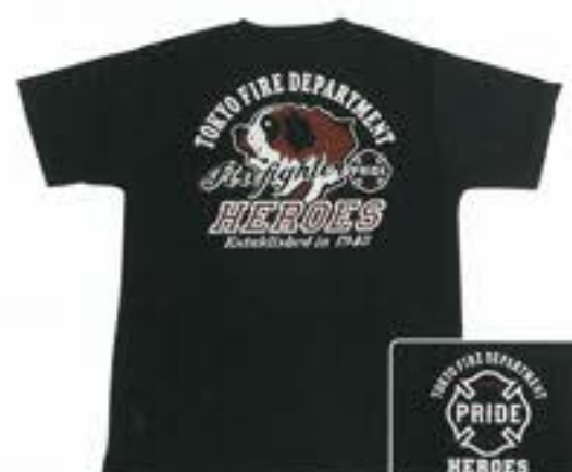
HEROESエアライドTシャツ(紺)