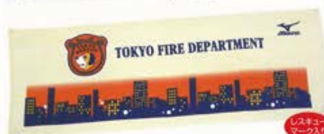
レスキュー スポーツタオル ●サイズ/400mm×1150mm ¥1,400 (税込)