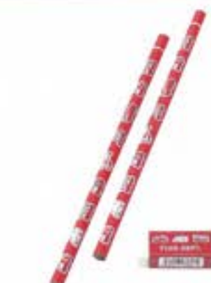
消防 鉛筆(2B)・消しゴムセット ¥200 (税込)