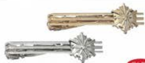
消防マーク(金・銀) 各¥770(税込)