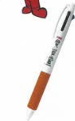
3色ボールペン (黒・赤・青:0.7) ¥500 (税込)