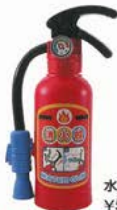
水ビストルファイアーマン ¥500 (税込)