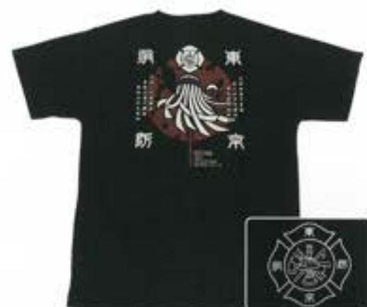
火消エアライドTシャツ(黒)