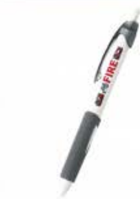
消防加圧ボールペン (黒:0.7) ¥250 (税込)