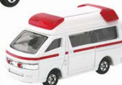
2 トヨタハイメディック救急車 (箱番79)