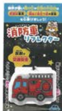
消防車リフレクター ●サイズ/55mm×65mm ¥80 (税込)