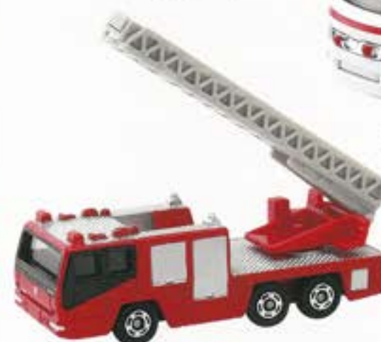
4 日野はしこ付消防車 (箱番108)