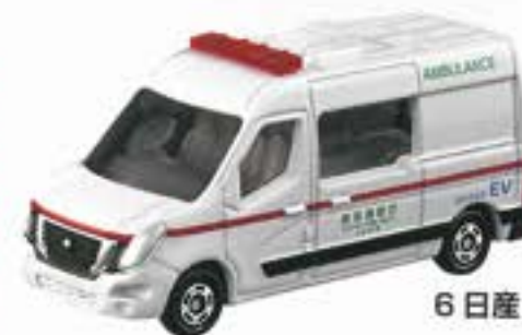
6 日産 NV400 EV救急車 (箱番44)