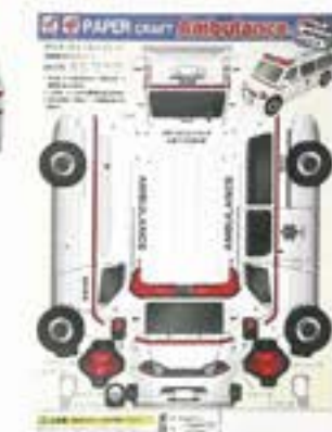
ペーパークラフト 救急車 ¥150 (税込)