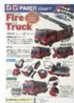
ペーパークラフト 消防車 ¥250 (税込)