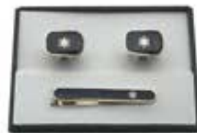
カフスセット 消防マーク(青) ¥1,300(税込)