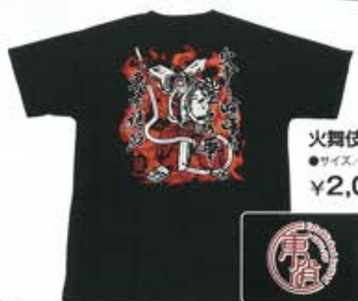
火舞伎エアライドTシャツ(黒)