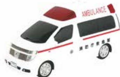
2 日産エルグランド救急車 ●サイズ/185mm×285mm ¥2,500 (税込)