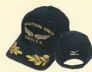
航空隊キャップ(子供用)(紺)