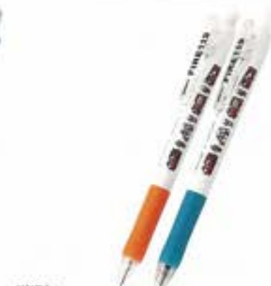
消防 ボールペン・シャープペンセット シャープペン:0.5/ボールペン:0.7 ¥300 (税込)