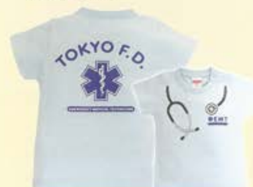
TOKYO.F.D なりきりキッズTシャツEMT