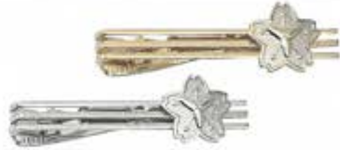
消防団 サクラ(金・銀) 各¥770(税込)