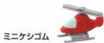
ミニケシゴム ¥60 (税込)