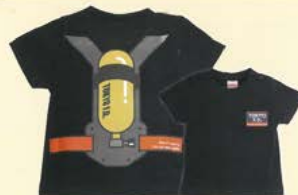
TOKYO.F.D なりきりキッズTシャツFIRE