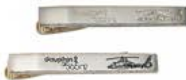
ヘリドーフアン(金・黒) 各¥990(税込)