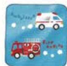
消防ハンドタオル ●サイズ/200mm×200mm ¥100 (税込)