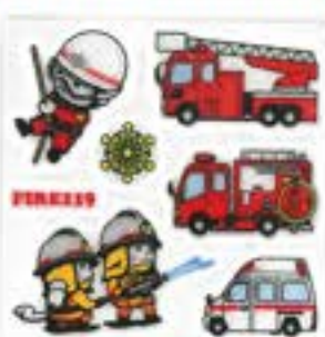
消防反射シール ●シールサイズ/70mm×70mm ¥120 (税込)