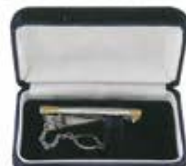
ネクタイピン純銀製 鷹口(とびぐち) ¥5,000(税込)