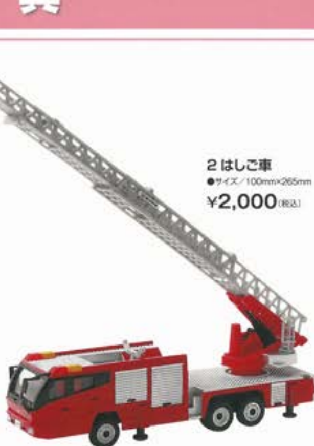
2 はしご車 ●サイズ/100mm×265mm ¥2,000 (税込)