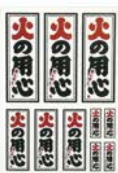
火の用心シール ●サイズ/260mm×185mm ¥150 (税込)