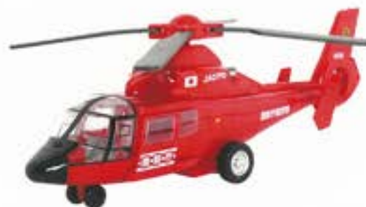
4 消防レスキューヘリコプター ●サイズ/170mm×400mm ¥2,900 (税込)